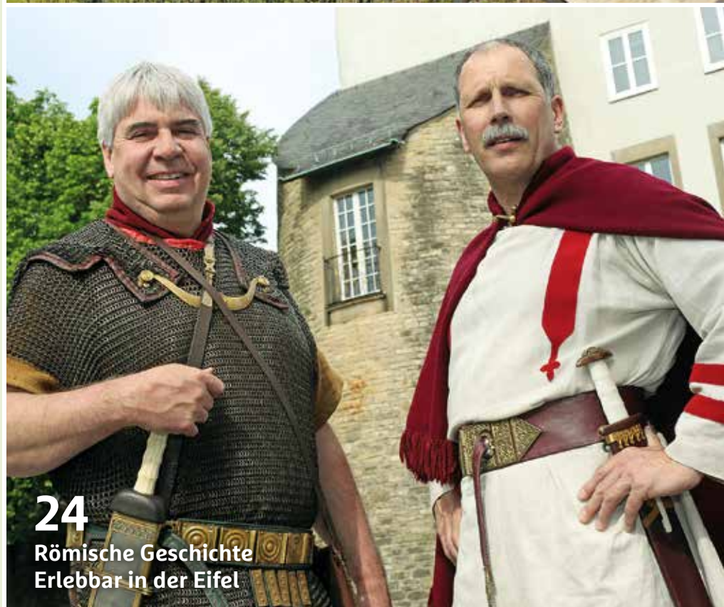
24 Römische Geschichte Erlebbar in der Eifel