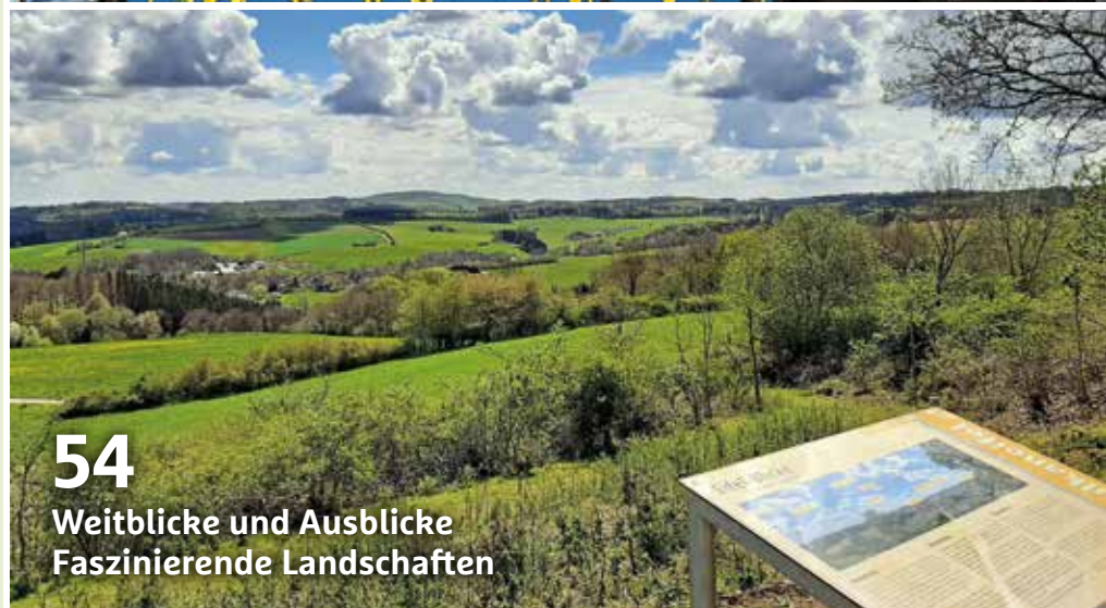
54 Weitblicke und Ausblicke Faszinierende Landschaften