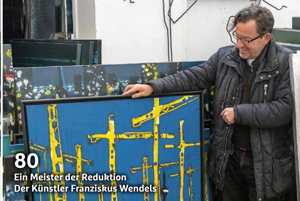
80 Ein Meister der Reduktion Der Künstler Franziskus Wendels