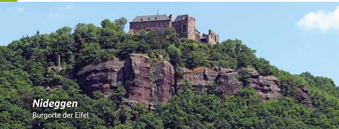
Nideggen Burgorte der Eifel

Die nächste Ausgabe erscheint am 3. September 2021 unter anderem mit folgenden Themen: